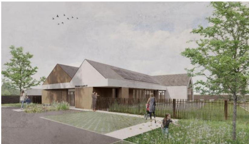
Esquisse du périscolaire projeté

Le bâtiment périscolaire définitif permettra d'accueillir 80 enfants de l'école primaire d'Hipsheim-Ichtratzheim (maternelles et élémentaires).