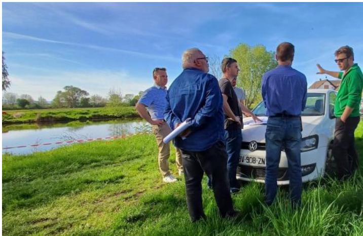
Réunion de chantier de préparation des travaux

Les 61.000€ TTC de dépenses sont financés à 80% par :