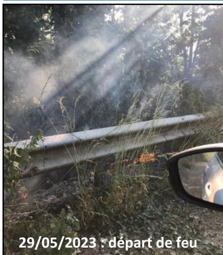
départ de feu de végétation maîtrisé par la police municipale et éteint par les pompiers (pont SNCF, 29 mai 2023)