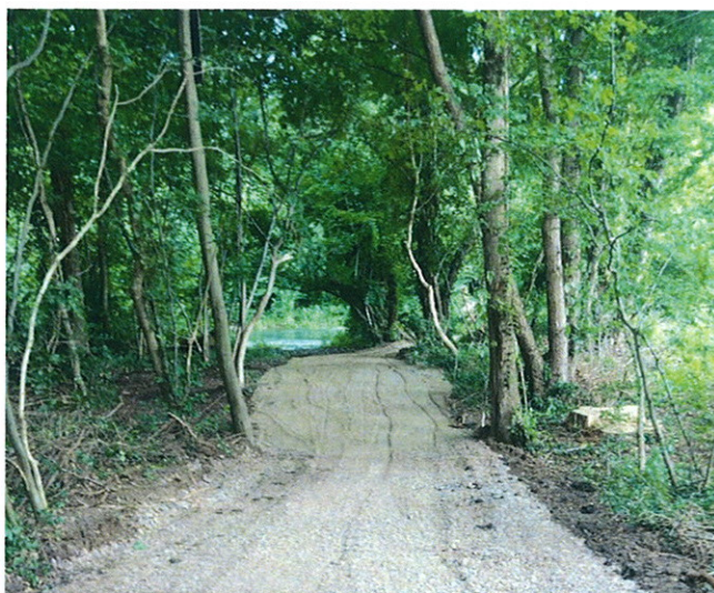
Chemin d'accès aux ouvrages « Kleindichel » et « Grossdichel »